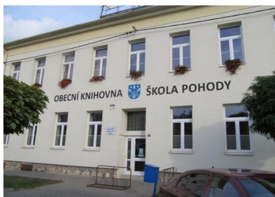
Dokončení, ze "staré školy" máme "Školu pohody"