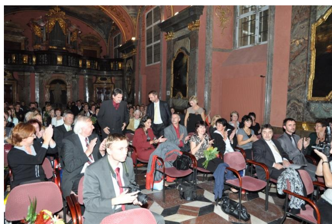
Právě zaznělo: Knihovnou roku 2012 se stává.... a my vyrážíme