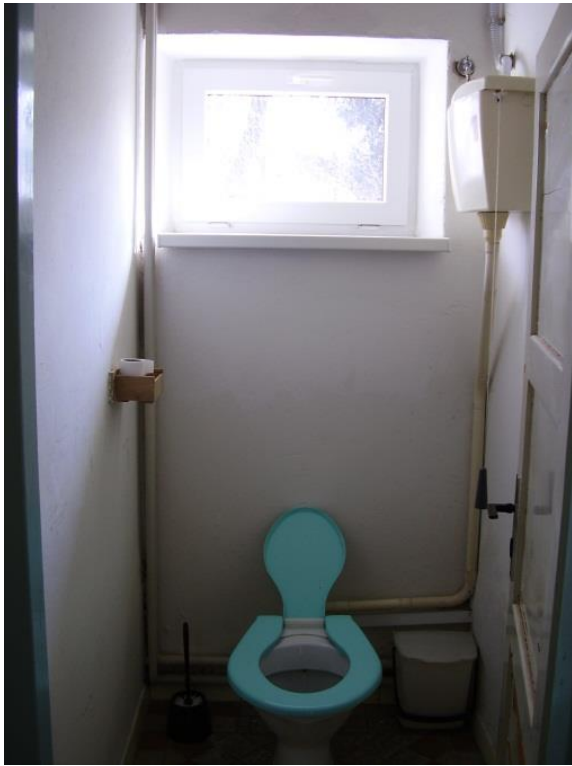
WC před rekonstrukcí