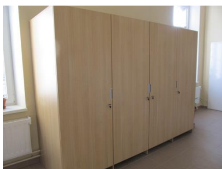
Skříň na uložení židlí