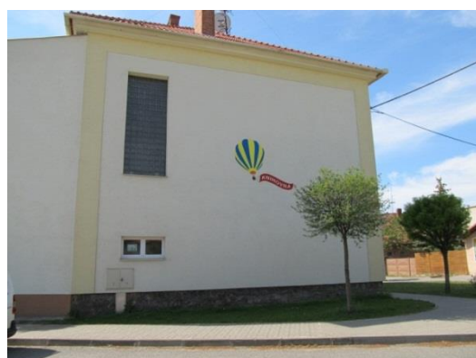
Pohled z boku