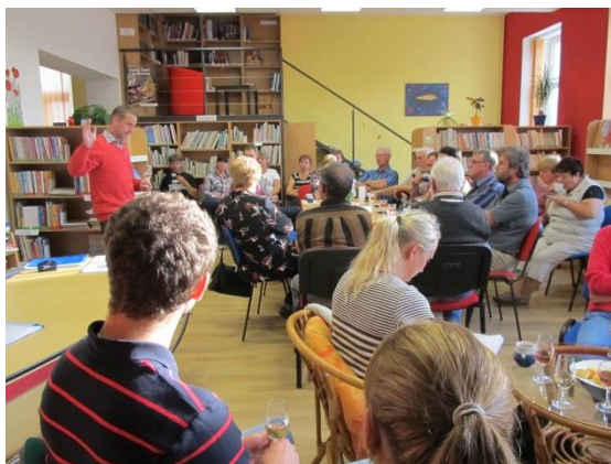
Starostové a zastupitelé z Hustopečska