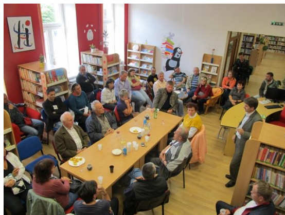
Obrázek 1 Starostové a zastupitelé z Lipníka nad Bečvou a okolí