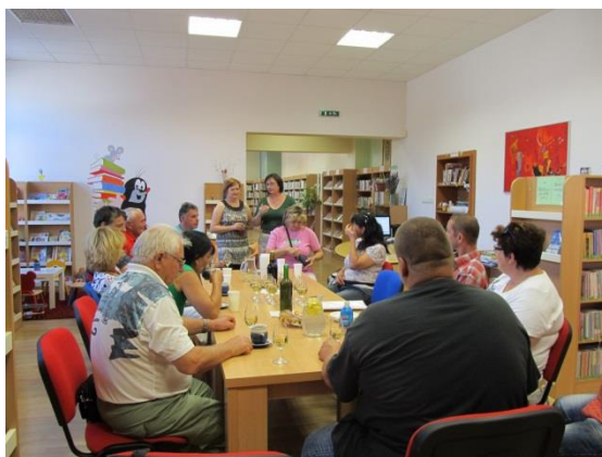
Starostové a zastupitelé z Českého Švýcarska

Naši knihovnu si přišla prohlédnout skupina starostů a zastupitelů z Kutnohorska, Českého Švýcarska, Lipníka nad Bečvou a okolí, Hustopečska, knihovníci z knihovny Kroměřížska. Na konzultaci přijelo několik starostů se svými knihovníky z okolí.