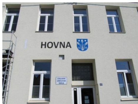
Započetí práce ....

Když už jsme měli příjemný interiér knihovny, chtěli jsme, aby vypadala budova hezky i zvenku.