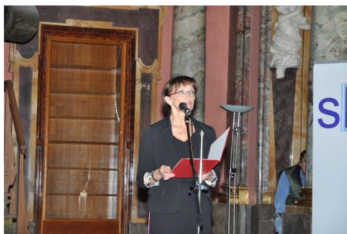
Úvodní slovo ministryně kultury Mgr. Aleny Hanákové