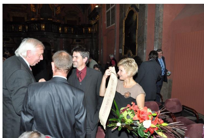
Gratulace a předání daru z Veselice, držitele titulu Knihovna roku 2011