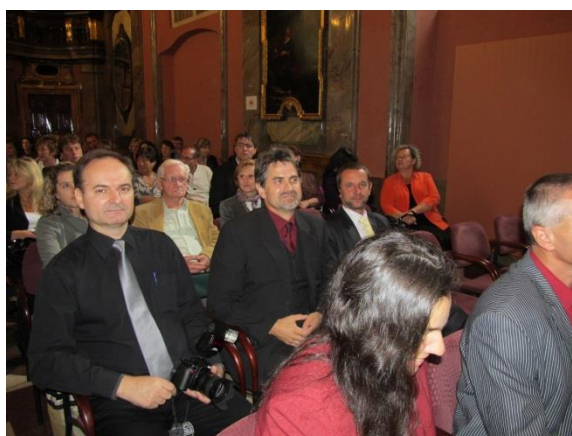
Pan ředitel školy, starosta a místostarosta v očekávání