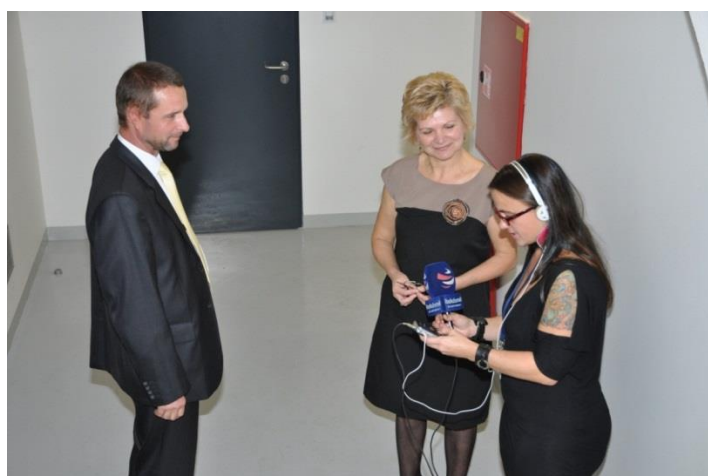
Rzhovor pro Radiožurnál, který šel přímo do éteru